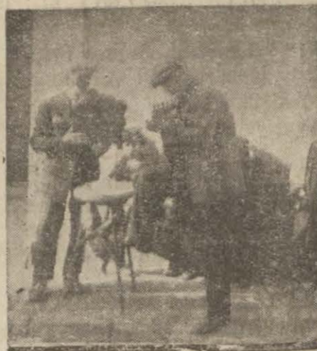
Bir sazende heyeti sokakta satış yapıyor

Hiç tesadüf etmediniz mi? Köşe başlarında saz çalarak öteberi satan seyyar çalgıcılar var. Eskiden macuncuların, oyuncakçılarının, zurna, klarnet