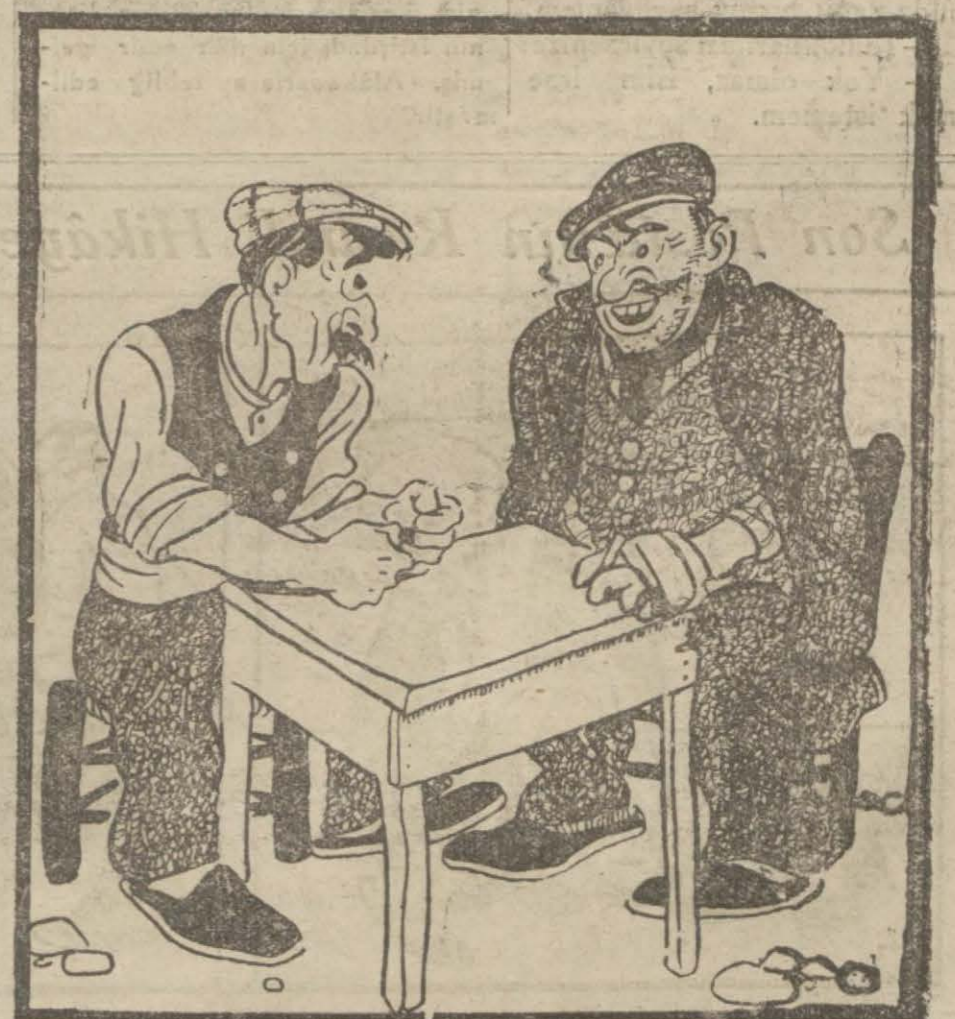
— Alman polisleri İstanbul'a gelmişler.. — Desene ki tam Almanyada bulunacağımız zamad!